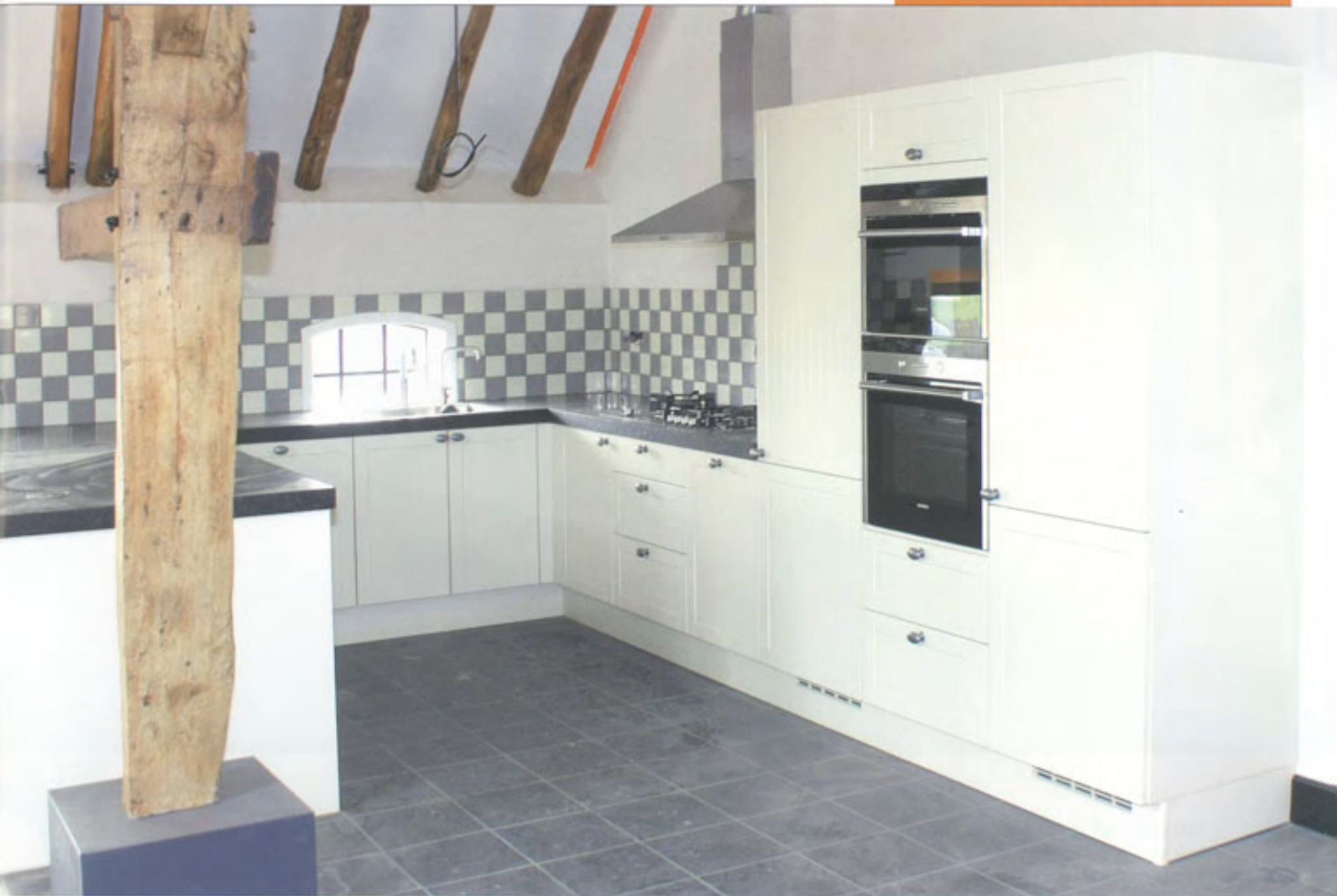
Fraai contrast: moderne keukens tussen een anderhalve eeuw oud houtskelet.

Dat gaf in ieder geval de mogelijkheid de niet-originele versterkingsconstructie te verbergen. Ik heb voor de isolatie gebruik gemaakt van Isobouw Slimfix panelen, die je heel gemakkelijk over de gordingen kunt leggen. Eerst keken ze bij Isobouw wat vreemd op van mijn project omdat ze zo iets nog niet hadden meegemaakt, maar al snel werden ze enthousiast en heb ik heel veel medewerking gekregen.'